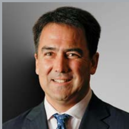
Jean - Paul Luksic Fontbona DIRECTOR

Rut: 6.372.368-1 Director de Empresas B.Sc. Management and Science, London School of Economics, Inglaterra