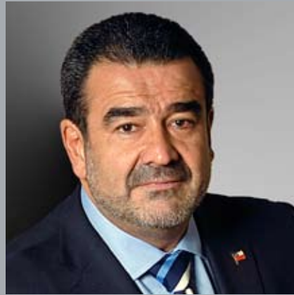
Andrónico Luksic Craig VICEPRESIDENTE