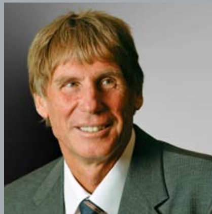
Hernán Büchi Buc DIRECTOR

Rut: 5.718.666-6 Ingeniero Civil en Minas, Universidad de Chile