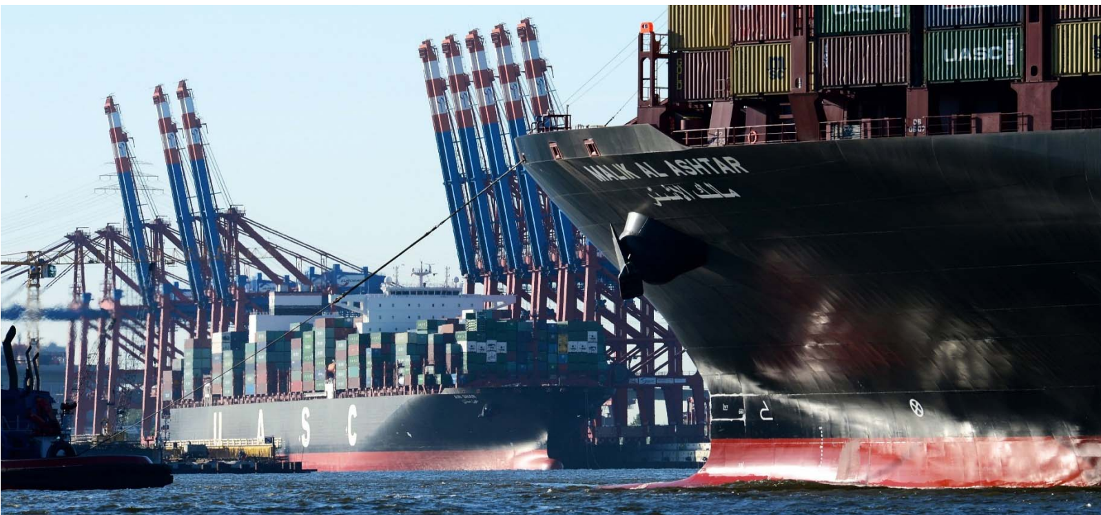
M/N Malik Al Ashtar y M/N Ain Snan, naves portacontenedores de 13.500 TEU, año 2012, en el puerto de Bremerhaven, Alemania. Naves de propiedad de la naviera UASC, hoy filial de Hapag-Lloyd AG.

ESTADOS FINANCIEROS CONSOLIDADOS Al 31 de Diciembre de 2017 y 2016